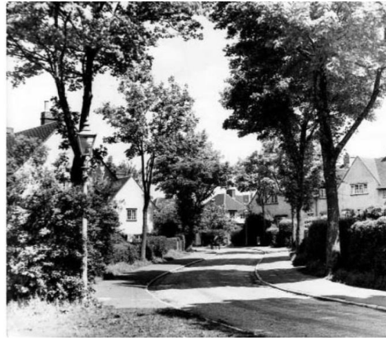
شکل ۱. نگاره ویلیام بلانچارد جیروولد از محله‌های فقیرنشین لندن سده نوزدهم و محیط زندگی توسعه اولیه در لچورث (Town and Country Planning Association, 2014: 7)

از جمله اولین شهرک‌های جدیدی که در دوره مدرن ساخته می‌شود، مربوط به شهرک‌های جدید لندن در بین سال‌های ۱۹۴۶ تا ۱۹۴۹ است. کارکرد اصلی این شهرک‌های جدید، جذب جمعیت سرریز لندن بوده است. این نوع کارکرد شهرک‌های جدید، زمینه‌ای برای روند تمرکززدایی جمعیت درون مناطق مادرشهری می‌شود. در برخی کشورها، از جمله اروپای قاره‌ای، از جمله اهداف رایج احداث و شکل‌گیری شهرک‌های جدید، افزون بر توزیع جمعیت، توزیع اشتغال نیز بوده است. بر این اساس، زمین دولتی و حمل و نقل عمومی سبب تسهیل هدف نهایی، یعنی ایجاد جامعه‌ای متعادل و متوازن در محیط‌های دوستدار محیط‌زیست می‌شود (Hall and Tewdwr-Jones, 2002; Parsons and Schuyler, 2002; Ward, 2004; 2011). در دهه ۱۹۷۰، شهرک‌های جدید در پیرامون اکثر مراکز شهری اصلی (به ویژه پایتخت‌ها) شکل می‌گیرد. در این نوع شهرک‌های جدید، جمعیت موردنظر حدود ۲۵۰-۳۰۰ هزار نفر در نظر گرفته شده که طیف گسترده‌ای از مشاغل و درآمدهای خانوار را امکان‌پذیر می‌سازد. در بین شهرک‌های جدید در اروپا، می‌توان به شهرک‌های جدید پیرامون پاریس اشاره کرد که بیش