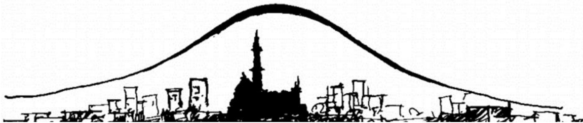
شکل ۲. منحنی ارزش زمین در اطراف اماکن مذهبی در شهرهای کهن.

مساجد تنها در کانون بازار متمرکز نمی‌شوند، آن‌ها در نواحی مسکونی نیز پراکنده هستند. بنابراین هر محله حداقل یک مسجد دارد. مساجد محلی در مرکز هر بخش مسکونی در طول بازار محلی و در کنار چند ساختمان عمومی دیگر قرار گرفته‌اند (حبیبی، ۱۳۹۴).