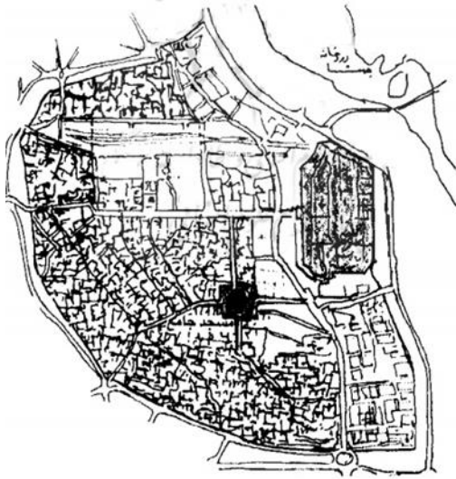
شکل ۱. منتهی شدن شریان‌های اصلی و

مهم شهر به سمت مسجد. منبع: (پورجعفر، ۱۳۸۱) مساجد به ویژه مساجد بزرگتر به منظور قابل رؤیت شدن از قسمت‌های مختلف شهر، مناره‌هایی بلند برافراشته در گوشه‌های ساختمان مسجد و مشرف به ساختمان‌های پیرامونی شهر داشتند (ملک آبادی، ۱۳۹۹). این مناره‌ها معمولاً بلندترین بناهای شهرهای سنتی ایران را تشکیل می‌دادند.