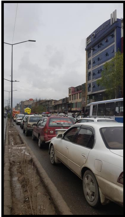
تصویر ۴. دگرگونی مصالح در خیابان میوند اصطلاح حس تعلق به مکان اغلب با اصطلاحاتی از قبیل هویت مکان و حس مکان به صورت متناوب به کار می‌رود. (Bahzada Sekopy, Azim, & Adalifar, ۱۴۰۱)

برای گسترش شهری بزرگ که دامنه‌های پرجمعیت و مرکز شهر را تسکین می‌دهد، برنامه‌ریزی شود. دامنه‌های تپه‌ها و سواحل رودخانه‌ها باید به‌عنوان مناطق سرسبز، برای کنترل فرورانشست زمین و کنترل فرسایش، بهبود آلودگی هوا و آب، و تفریحی که برای همه ساکنان در دسترس باشد، حفظ شود. (Barbe, 2013)