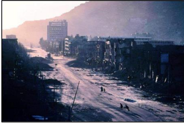
تصویر ۱. خیابان میوند دهه ۶۰ ه.ش تصویر ۲. خیابان میوند دهه ۶۰ ه.ش

کابل و دیگر شهرها مهاجرت کردند. (T, 2018) شود.