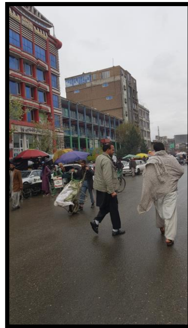
تصویر ۳. دگرگونی مصالح در خیابان میوند ۱

برای گسترش شهری بزرگ که دامنه‌های پرجمعیت و مرکز شهر را تسکین می‌دهد، برنامه‌ریزی شود. دامنه‌های تپه‌ها و سواحل رودخانه‌ها باید به‌عنوان مناطق سرسبز، برای کنترل فرورانشست زمین و کنترل فرسایش، بهبود آلودگی هوا و آب، و تفریحی که برای همه ساکنان در دسترس باشد، حفظ شود. (Barbe, 2013)